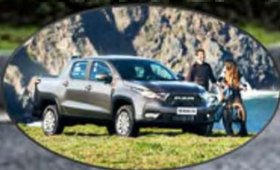
Disfruta tus caminos