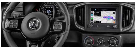
Lo que Necesitas Para Estar Interconectado y Actualizado

Es una pickup moderna, versátil y diseñada para quienes buscan combinar capacidad de trabajo, comodidad y estilo en un mismo vehículo. Su diseño robusto y su presencia imponente se complementan con un motor eficiente y confiable, capaz de ofrecer un desempeño sólido tanto en ciudad como en caminos exigentes. La RAM 700 BigHorn brinda espacio cómodo para hasta cinco ocupantes sin sacrificar su capacidad de carga. Su carrocería reforzada, junto con una suspensión preparada para uso intensivo, garantiza estabilidad y durabilidad incluso bajo condiciones demandantes. Destaca por su interior funcional, con controles intuitivos, ergonomía y opciones que aumentan la seguridad y practicidad en el día a día. Además, su bajo consumo de combustible y mantenimiento económico la convierten en una opción ideal para clientes que buscan maximizar su inversión. En resumen, la RAM 700 BigHorn es la combinación perfecta entre fuerza, eficiencia y confort, una pickup lista para trabajar y lucir bien donde vaya.